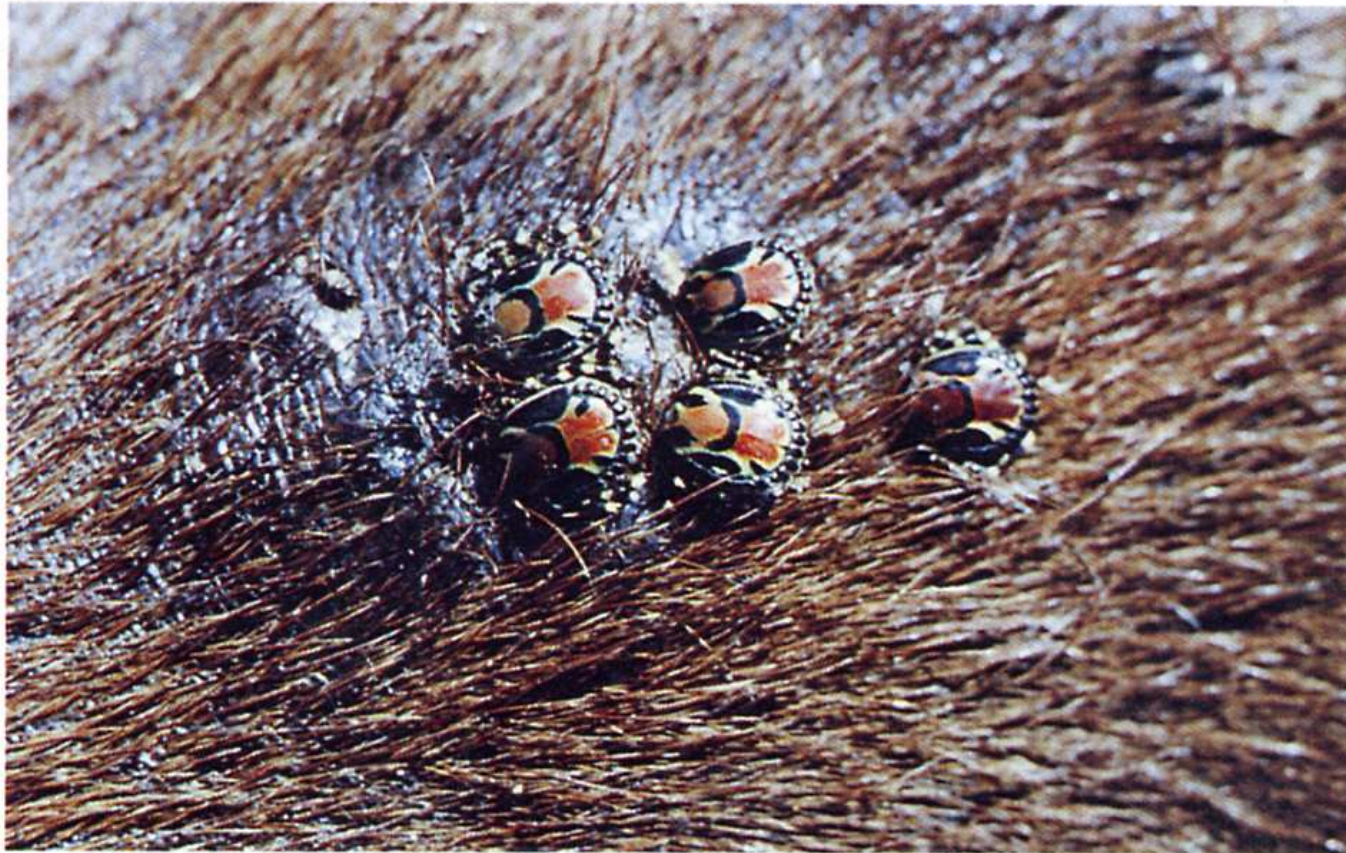
Photo 1 : Lésion de fixation des tiques : ces lésions sont surtout importantes avec les espèces à rostre long, telles les Amblyomma.