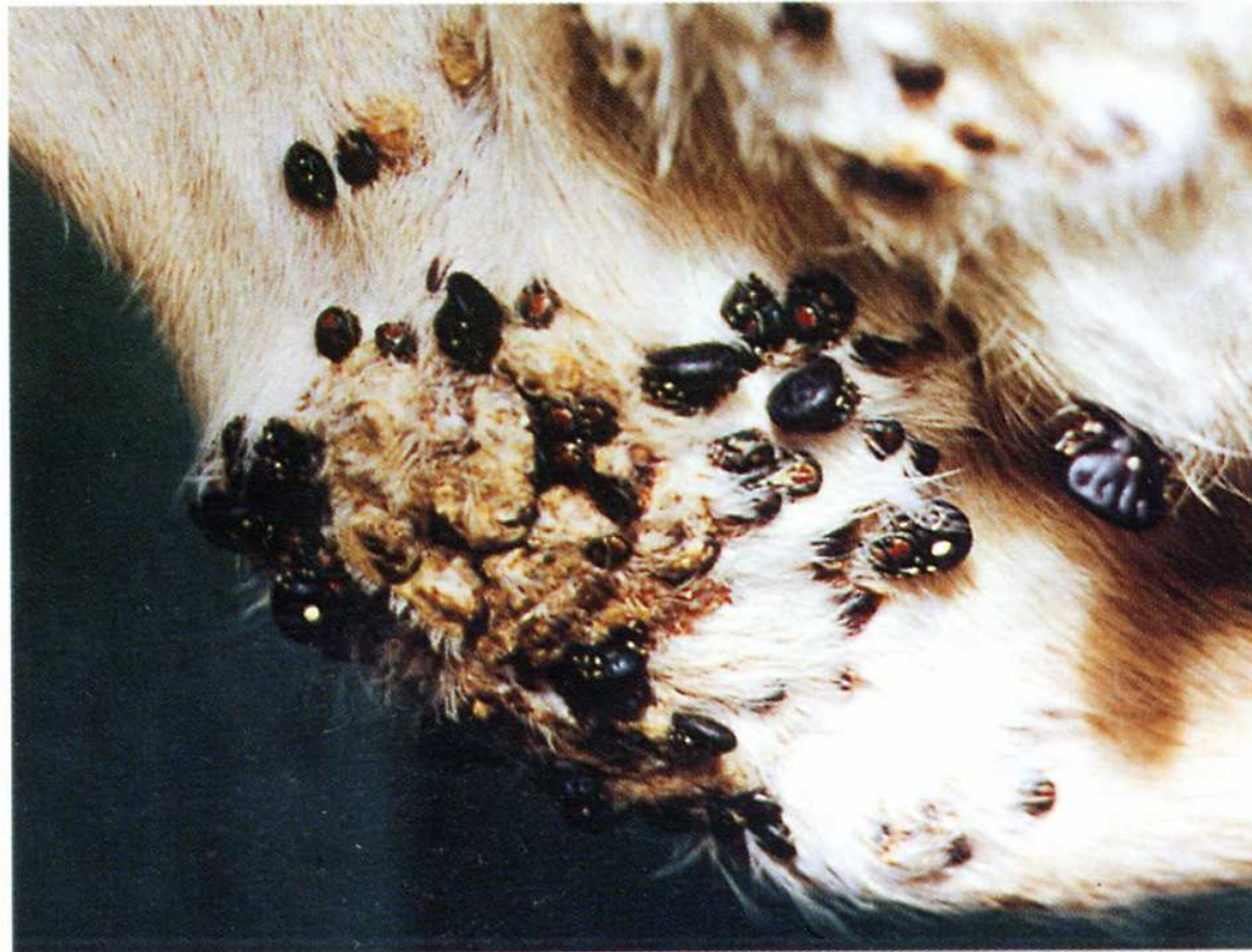
Photo 2 : Lésion de dermatophilose et tiques sur le fanon d'un bovin : les Amblyomma sont incriminés dans la propagation de la dermatophilose.